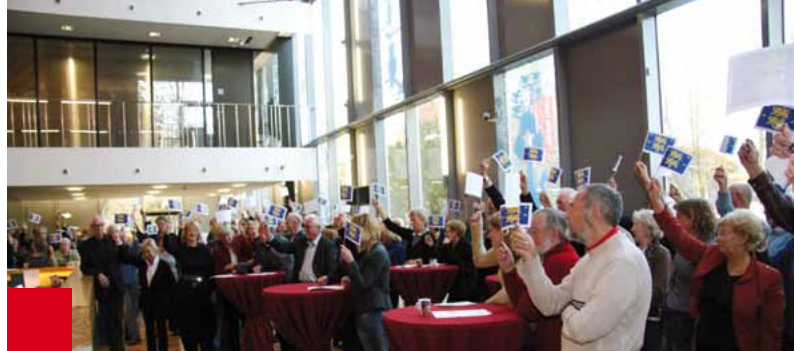
Tijdens de presentatie van de West-Friese canon werd een verkorte versie van het West-Frieslands spel gespeeld.

De digitale versie van de Canon staat op Internet ( www.regiocanons.nl/noord-holland/west-friesland ). Deze website wordt beheerd door het Westfries Archief. Ook Amsterdam, de Zaanstreek en de regio 'tussen Vecht en Eem' hebben inmiddels een canon gepubliceerd. Samen met die van Kennemerland, Waterland, Noordkop en Texel, en Amstel- en Meerlanden (inclusief de Haarlemmermeer) beslaan deze canons uiteindelijk de hele provincie Noord-Holland.