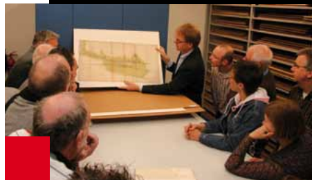
Bestuurders en raadsleden van Opmeer bewonderen een kaart van Opmeer en Spanbroek uit ca. 1592.