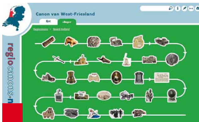
De slinger van de vensters van de West-Friese canon vormt de startpagina van de versie op het Internet.