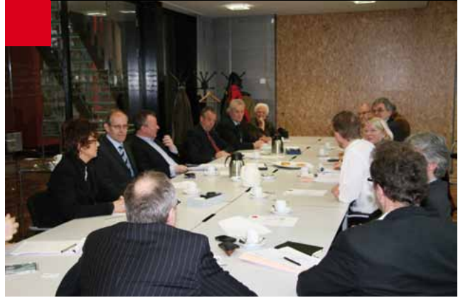
Constituerende vergadering van het nieuwe bestuur van het Westfries Archief, januari 2009.

geling dan ook gewijzigd. Het nieuwe bestuur zal de verdere ontwikkeling van het Westfries Archief naar een Regionaal Historisch Centrum vorm gaan geven. De archiefcommissie, bestaande uit de gemeentesecretarissen van de deelnemende gemeenten, blijft betrokken bij het Westfries Archief als vaste commissie van advies.