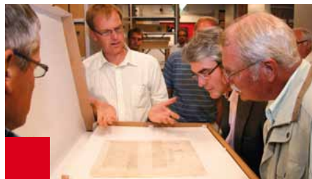
De gemeenteraad van Koggenland kreeg tijdens een werkbezoek in juli dit charter uit 1408 te zien, waarin de Veenhoop op eigen verzoek onder het rechtsgebied van Hoorn werd gebracht.