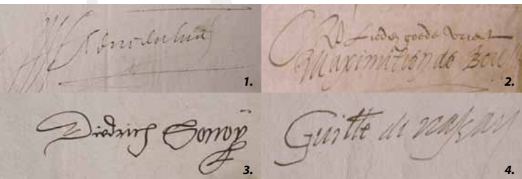
Landelijke Archiefvondag stond in het teken van het thema Oorlog en Vrede. Het Westfries Archief besteedde onder andere aandacht aan de Opstand, beter bekend als de Tachtigjarige Oorlog. In onze archieven zijn de handtekeningen van de hoofdrolspelers te vinden:

Voor vragen over stamboomonderzoek en verhalende bronnen in archieven konden bezoekers terecht bij vrijwilligers van de afdeling Oostelijk West-Friesland van de Nederlandse Genealogische Vereniging en de Stichting Westfriese Families.