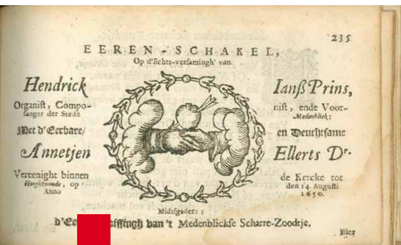
De samensteller van het Scharre-Zoodtje vermeldde in het boekje waar, wanneer en met wie hij trouwde. Hiermee dateerde hij zijn uitgave tamelijk exact: tussen 14 augustus en 31 december 1650.