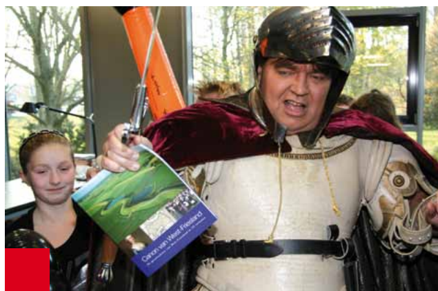
Roomskoning Willem II, graaf van Holland, wordt overmeesterd en zal even later de Canon van West-Friesland overhandigen aan de voorzitter van het Westfries Genootschap.