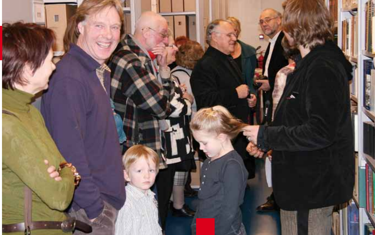
Rondleiding tijdens de afsluitingsbijeenkomst van de tentoonstelling Jonge Helden in de Band