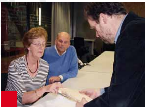
Een bijzondere aanwinst van 2008 was een doopboek uit Opperdoes over de periode 1662-1748. Het doopboek was in particulier bezit

Er verscheen een helder licht en een stem uit de hemel riep hem tot driemaal toe!