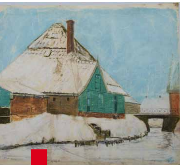
Boerderij te Hoogkarspel, getekend door G.H. Lückens in 1929

De collectie is in 2008 uitgebreid met circa 275 publicaties; het grootste deel betreft schenkingen. Deze variëren van in eigen beheer uitgegeven jaarboeken en genealogieën of ingebonden tijdschriften uit het begin van de twintigste eeuw, tot meer zeldzame 17e-eeuwse uitgaven. Als uitvloeisel van de levering van beeldmateriaal door het Westfries Archief neemt ook het aantal bewijsexemplaren voor de bibliotheek toe.