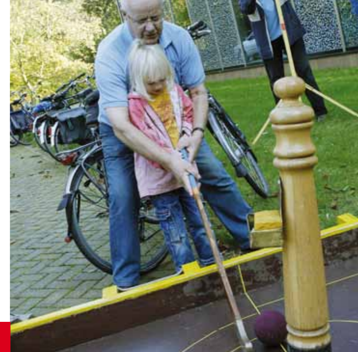
Kolfvereniging De Vier Eenen uit Spanbroek laat de bezoekers kennismaken met de kolf sport

Jonge onderzoekers, tussen 10 en 14 jaar, konden zich aan het einde van de dag storten op een stukje oud-schrift. Een groepje leergierigen kreeg van een medewerker van het archief een lesje 'paleografie' (lezen van oude handschriften). Vooral het zelf schrijven van de eigen naam met oude lettervormen uit de 17e eeuw bleek een schot in de roos. De gelezen teksten, kopieën uiteraard, werden na afloop enthousiast mee naar huis genomen.