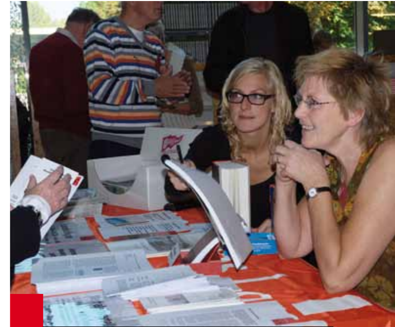
Landelijke Archiefdag, 11 oktober 2008

De bezetting op de studiezaal in de nieuwe situatie van een zelfstandig gebouw is een aantal keer aan de orde geweest in de archiefcommissie. Uit logistieke en veiligheidsoverwegingen is een dubbele bezetting noodzakelijk. Maar dit legt een grote druk op de archiefmedewerkers. Om deze nood te lenigen, is in de oorspronkelijke exploitatieopzet uitgegaan van een uitbreiding van de formatie. De beslissing hierover is in de afgelopen jaren uitgesteld vanwege de onzekerheden die de bouwkosten met zich mee brachten. In 2008 bleek het echter mogelijk om de geplande uitbreiding van de formatie te realiseren zonder dat dit gevolgen heeft voor de jaarlijkse bijdrage.