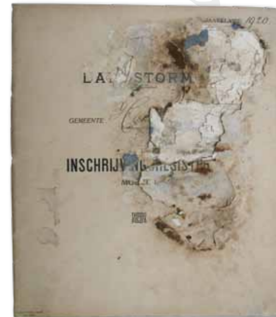
Dit inschrijvingsregister voor de Landstorm is hoognodig aan restauratie toe