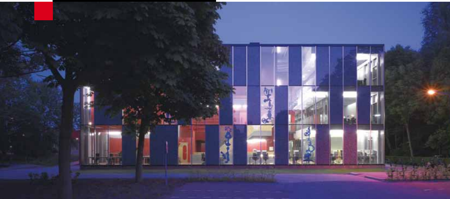
Gebouw Westfries Archief

In het kader van de gewijzigde gemeenschappelijke regeling wordt bekeken of de huisvestingskosten in de toekomst niet beter op een andere wijze kunnen worden toegerekend.