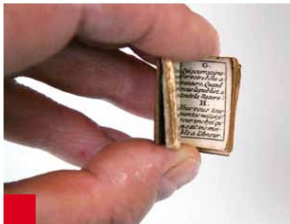
Het kleinste boekje uit de bibliotheek. Het 2,5 cm hoge Franse boekje bevat opvoedkundige teksten. Het heeft de toepasselijke naam Petit Poucet (Klein Duimpje)