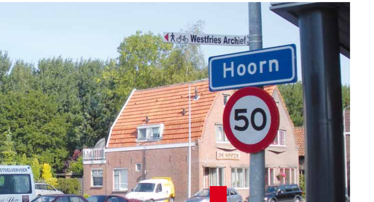
Verwijsbord naar Westfries Archief

Het aantal bezoeken van de website nam toe van circa 35.000 in 2007 naar bijna 43.000 in 2008. De verwachting is dat door het aanbieden van gedigitaliseerde bronnen als Burgerlijke Stand, Bevolkingsregisters en de Doop-, Trouw- en Begraafboeken dit aantal fors zal toenemen.