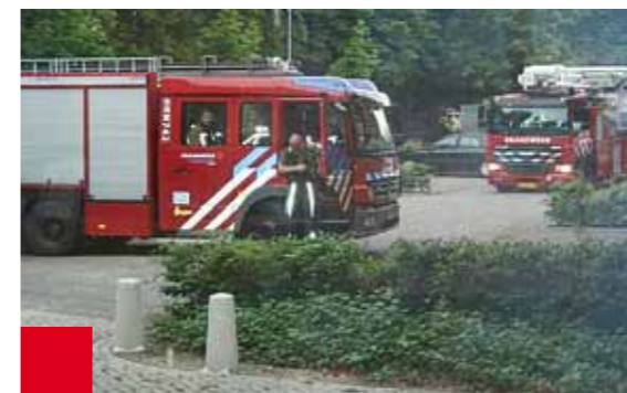
Op 28 mei 2008 ontstond er een begin van brand in één van de depots. Doortastend optreden van de brandweer heeft een ramp voorkomen

Er zijn vanaf de ingebruikname van het gebouw nog steeds enkele problemen met het functioneren van de verlichting. Deze wordt geregeld door het computergestuurde gebouwbeheersysteem Feelfine. Dit systeem is dermate storingsgevoelig dat er voortdurend gebreken optreden. In overleg met Facilitaire Zaken wordt naar een oplossing gezocht.