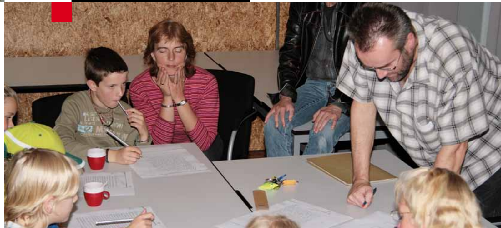
Cursus oud-schrift voor kinderen, georganiseerd tijdens de Landelijke Archiefvondag