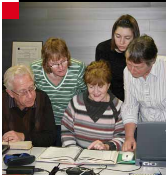
Vrijwilligers van de afdeling Oostelijk West-Friesland van de NGV zijn bezig de doop-, trouw- en begraafboeken digitaal toegankelijk te maken

Een medewerker van Op/maat werkte gestaag aan het digitaal toegankelijk maken de oude notariële archieven van voor 1812. In 2008 werden de boeken van notarissen van Abbekerk, Hauwert, Oostwoud en Twisk bewerkt. De database, die inmiddels alleen al zo'n 200.000 persoonsnamen telt, is beschikbaar op de computers op de studiezaal. Publicatie op Internet, in combinatie met de bronnen, zal de komende jaren moeten plaatsvinden.