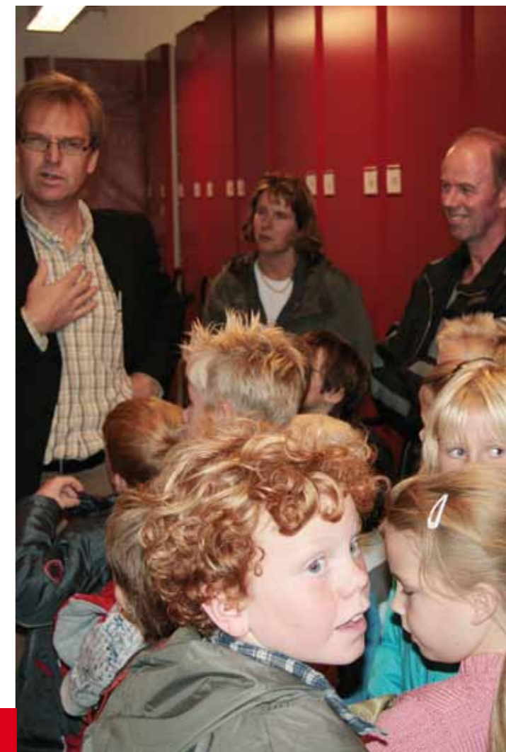
Kinderen van de Petrus Canisiusschool in de Weere brengen een bezoek aan het Westfries Archief

De expositie over 'Wonen', ingericht naar aanleiding van de Landelijk Archievendag 2007, liep in 2008 nog enige tijd door. Vervolgens werd in juni een expositie ingericht over de jaarboeken van het Westfries Genootschap. Aanleiding was de presentatie van het 75e jaarboek in het Westfries Archief. Deze vond plaats op 28 juni. Het eerste exemplaar werd door de voorzitter